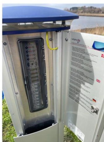
Frederiksværk Havn A.m.b.a.