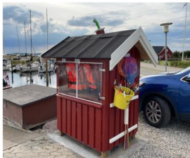
Frederiksværk Havn A.m.b.a.