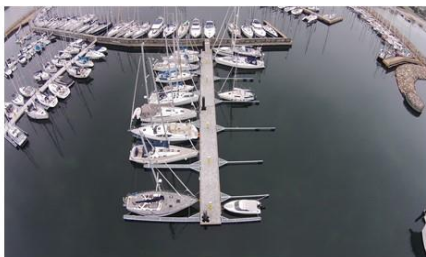
Frederiksværk Havn A.m.b.a.