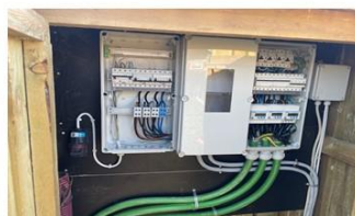
Frederiksværk Havn A.m.b.a.